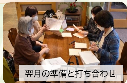
翌月の準備と打ち合わせ