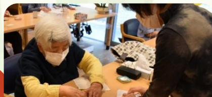
利用者様のあいだをまわって折り方を教えてくださいます。