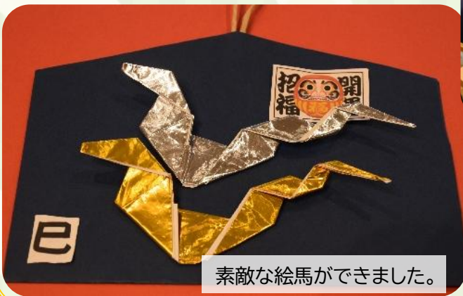
素敵な絵馬ができました。