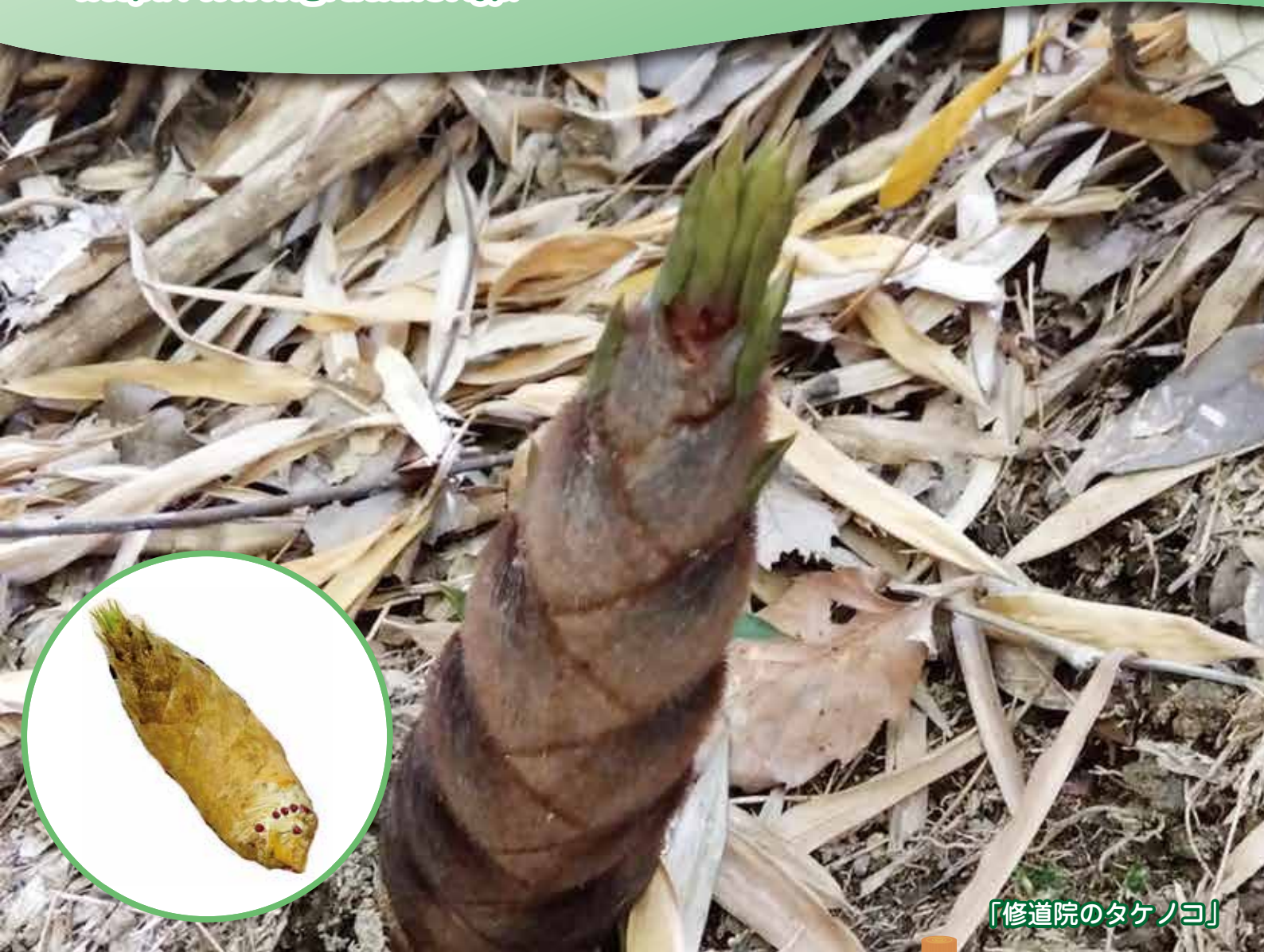
「修道院のタケノコ」